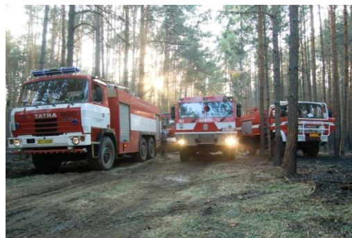
Řidiči těžké požární techniky se museli vyrovnat v terénu s jemným pískem

Do boje s ohněm byly vyžádány vrtulníky Letecké služby , již v 17:15 hodin odstartoval ze základny v Brně vrtulník s hasícím vakem. Vzhledem k vývoji požáru byl vyžádán další vrtulník s hasícím vakem, který odstartoval v 18:45 hodin ze základny v Praze. Oba vrtulníky za tmy ukončily hasební činnost na místě zásahu a vrátily se na základnu do Brna. Celkem provedly 59 shozů hasební látky (voda s tzv. smáčedlem, aby voda lépe pronikala ke kořenům stromů).