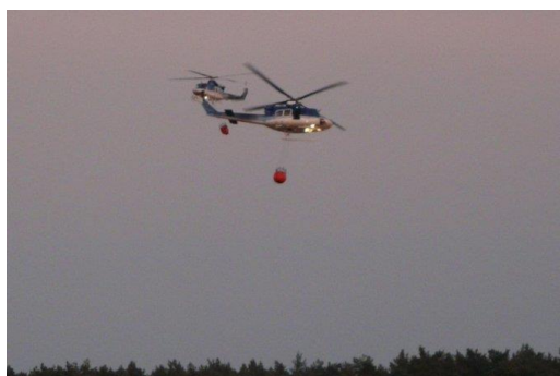
I další den pokračovalo letecké hašení vrtulníky

Letecký průzkum provedený brněnským vrtulníkem v neděli 27. května 2012 v 5:30 hodin ráno, potvrdil, že se v prostoru již neobjevuje žádné plamenné hoření. Hasiči pokračovali v dohašování kořenů a prolévání hrabanky. Požárem byla zasažena plocha o výměře cca 200 ha lesního porostu, z toho oheň zničil cca 150 – 170 hektarů borového lesa. Na zasedání štábu velitele zásahu bylo rozhodnuto, že vrtulníky již nebudou nasazeny k hasební práci. V průběhu dne prováděl vrtulník Letecké služby monitoring místa zásahu.