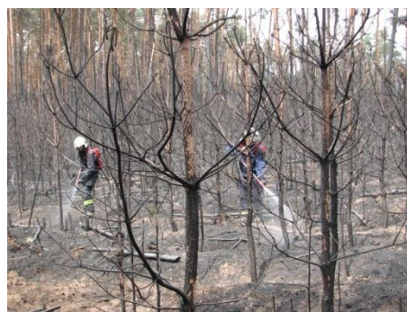
Vyhledávání lokálních ložisek a jejich dohašení

Vrtulníky Letecké služby na hašení požáru nalétaly celkem 57:12 hodin a provedly 364 shozů, tj. cca 350 t vody.