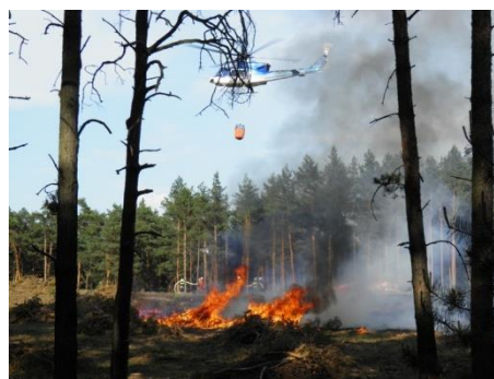
Nasazení dvou vrtulníků Bell 412 s hasicím vakem

V pátek 25. května 2012 vzletl vrtulník k hasební činnosti již ve 4:00 hodiny ráno, v 6:00 hodin byl na plnicím místě u Bzence vystřídán druhým vrtulníkem. V ranních hodinách provedly vrtulníky 36 shozů hasební látky. Vzhledem k utlumení požáru a utišení větru pokračoval v další hasební činnosti vrtulník ze základny v Brně, vrtulník z pražské základny byl odeslán zpět. Po obědě však došlo znovu k rozhoření a intenzivnímu požáru lesního porostu. Byl opět vyžádán druhý vrtulník, který odstartoval ze základny v Praze v 13:30 hodin. Vedle vrtulníků Letecké služby byla nasazena i další letecká hasicí technika a to 3 letadla Letecké hasičské služby a jeden vrtulník Armády ČR. Ve večerních hodinách se hasičům podařilo požár lokalizovat a zastavit další jeho šíření a odstranit viditelný plamen. Dále hořely jen kořeny a hrabanka. V devět hodin večer bylo ukončeno i letecké hašení a vrtulníky se vrátily na základnu v Brně a v Praze. Oba vrtulníky během dne vypustily 152 vaků hasební látky.