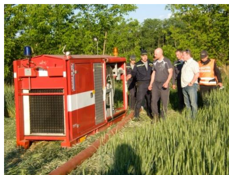
Náměstek ministra vnitra a náměstek policejního prezidenta na místě zásahu

V pondělí 28. května 2012 vrtulník ze základny v Brně monitoroval prostor, probíhalo dohašování posledních lokálních ložisek požáru, skrytá ložiska byla vyhledávána pomocí termokamer.