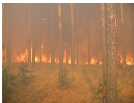
Požár se borovicovou monokulturou za přispění větru rychle šířil