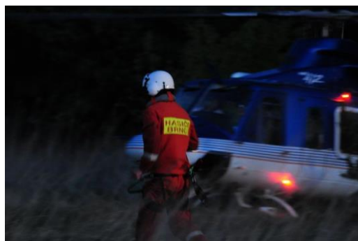
Letecké hašení pokračovalo do večerních hodin

V sobotu 26. května 2012 byly opět nasazeny k hasební činnosti oba vrtulníky Bell 412. Vrtulník ze základny Brno odstartoval hasit již v 5 hodin ráno, vrtulník pražské základny odstartoval v 7:27 hodin. Vzhledem k zesilujícímu větru v průběhu dne hrozilo rozšíření požáru, vhodně zvolenou taktikou zásahu se však tomuto podařilo zabránit a dalšímu rozšíření požáru již nedošlo. Vedle hasební činnosti byl nasazen vrtulník ze základny v Brně k monitorování prostoru požáru. Vrtulníky Bell 412 ukončily hasební činnost po 18 hodině, přes den realizovaly 117 shozů hasební látky.