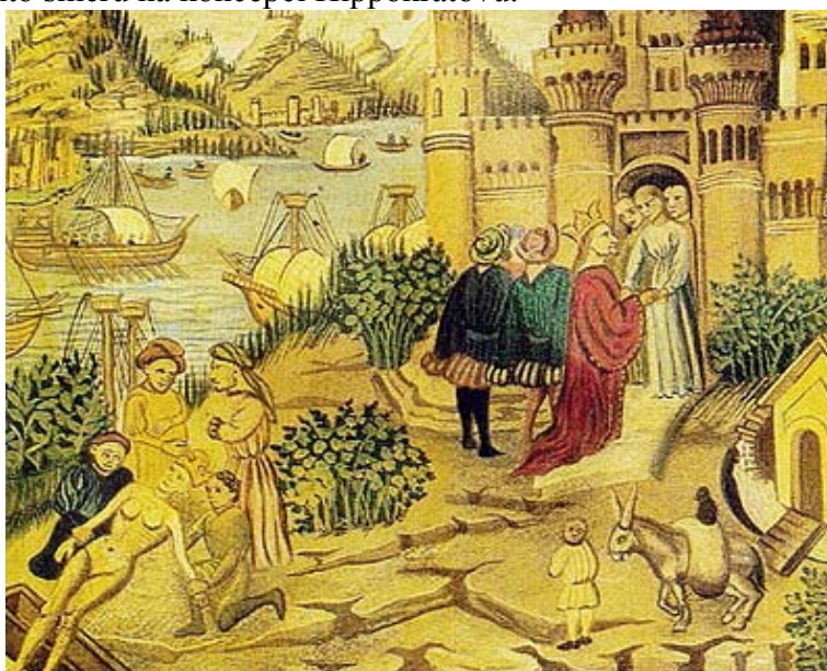
salernská lékařská škola

Je dost dokladů o tom, že salernská lékařská škola se věnovala i chorobám duševním a navazovala v tomto směru na koncepci Hippokratovu.